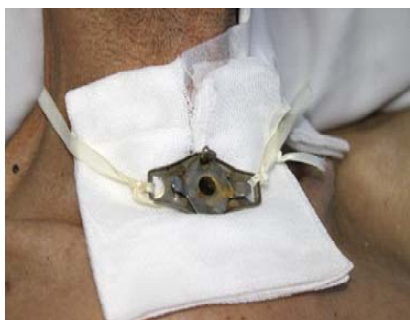
۶- یک گاز تمیز را مانند شکل دور لوله بگذارید.