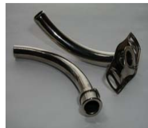
۷- روش شستشوی لوله تراکتوستومی